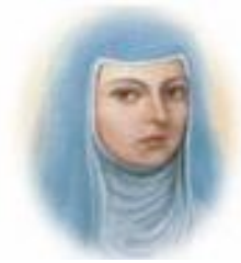
Joanna de Ângelis

Als jij in de Barmhartigheid van God gelooft, werk dan zonder verzwakking en koester de liefde in elke omstandigheid, zonder onderscheid of voorkeur. Herdenk Jezus, het Unieke Voorbeeld dat nog steeds niet het begrip en de acceptatie heeft gekregen dat hij waard is.”